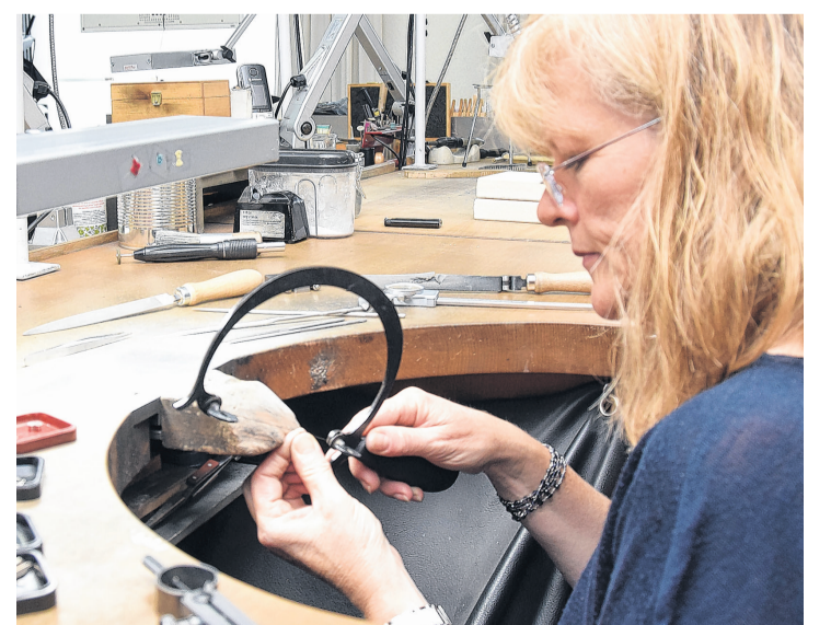
Präzises Sägen erfordert Fingerspitzengefühl.