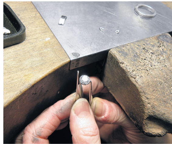
Die einzelnen Griffe werden dem Brillanten angepasst.