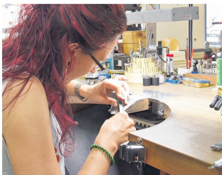
Auch beim Feilen wird der Ring in der Hand gehalten.

«Das Schmieden begeistert mich immer wieder von neuem.»