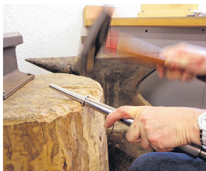
Beim Schmieden ist eine Kombination aus Kraft und Feingefühl gefragt.